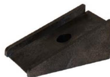
Nájezdový klín k EK90 Č. art. 09 090 0003