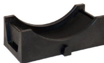
Tlumič hluku a vibrací EK90 Č. art. 09 090 0001