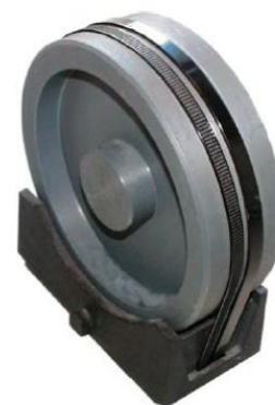
Tlumič hluku a vibrací EK90 s otvorem na protažení utahovací pásky Č. art. 09 090 0002